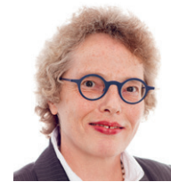
Magdalena Zimmermann