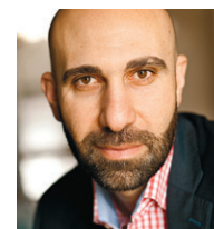
Ahmad Mansour